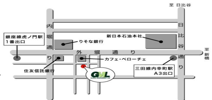
地図 / アクセス

株式会社グローバルマネジメント研究所 〒105-0001 東京都港区西新橋1-8-4 米山ビル2階 TEL: 03-3507-0100 交通機関 東京メトロ銀座線「虎ノ門」駅 1番出口徒歩3分 都営三田線「内幸町」駅 A3番出口徒歩5分 東京メトロ千代田線「霞ヶ関」駅 C3出口徒歩6分 JR「新橋」駅 日比谷口 7番出口徒歩8分 外堀通り沿いにある「カフェ・ペローチェ」の裏手になります